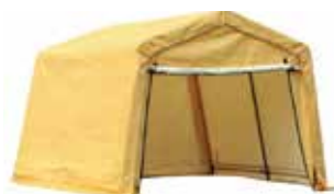
Abris d'auto opaques interdits