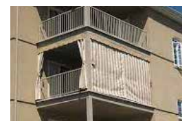
Abris/tambours interdits sur les balcons sans accès au terrain