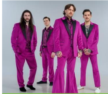
RSVP - 8 juillet à 19 h